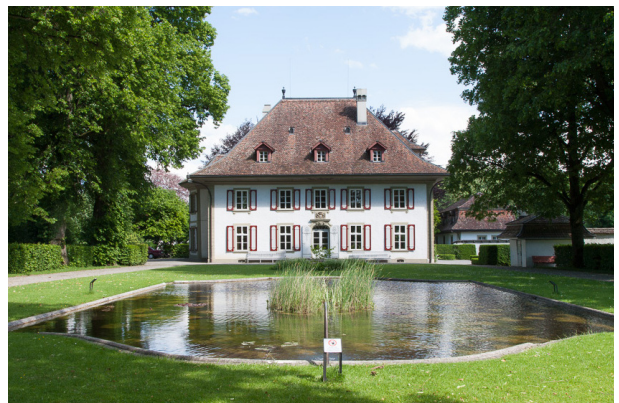
Bild links: Blick über den im 19. Jahrhundert romantisierten Teich auf die Gartenseite des Herrenhauses. Foto vor 1922 (Stadtarchiv Thun).