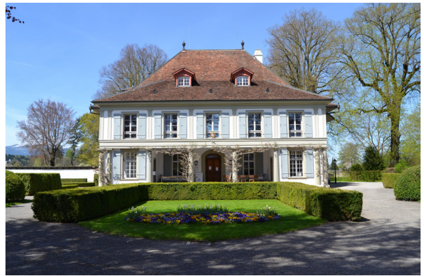
Bild links: Das Herrenhaus vom Ehrenhof aus. Foto vor 1922.