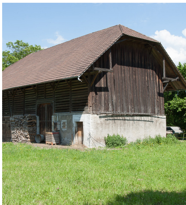
Bild oben: Blick von Südosten auf den hochrepräsentativen Gutshof von 1730/31. Foto von 2016.