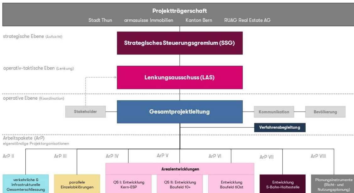
Abbildung 3 Gesamtorganisation Masterplanung

Die Gesamtorganisation definiert die verschiedenen Gremien sowie ihre Aufgaben und Zuständigkeiten. Aufgrund des hohen Koordinationsbedarfs zwischen den Verfahren und den Akteuren sollen zur Aufsicht und Lenkung des Gesamtprozesses ein strategisches Steuerungsgremium sowie ein Lenkungsausschuss eingesetzt werden. Die beiden Gremien bestehend aus Vertreterinnen und Vertretern der Grundeigentümerinnen VBS und RUAG Real Estate AG, der Infrastrukturbetreiberin der Bahn, des Kantons sowie der Stadt Thun. Das Strategische Steuerungsgremium (SSG) trifft strategischen Entscheidungen und vergibt Aufgaben an den Lenkungsausschuss (LAS). Der LAS initiiert und steuert die Arbeitspakete auf strategisch-operativer Ebene. Er trifft sich sechsmal pro Jahr. Für die organisatorische und inhaltliche Unterstützung dieser Gremien soll eine externe Verfahrensbegleitung beauftragt werden. Die Planung der einzelnen Projekte läuft in separaten Projektorganisationen.