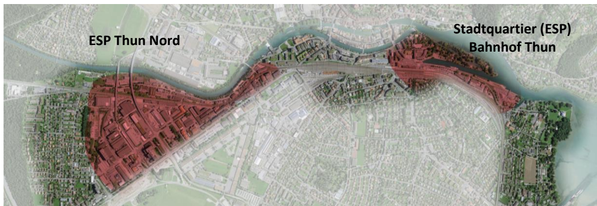
Abbildung 1 Übersicht Entwicklungsgebiete

Die Planungsarbeiten zur Entwicklung des Stadtquartiers (ESP) Bahnhof Thun und des Entwicklungsschwerpunkts (ESP) Thun Nord laufen seit mehreren Jahren und stehen vor einer neuen Phase. Beide ESP stellen innerhalb des Stadtentwicklungskonzepts Thun 2035 für die Entwicklung der Stadt zentrale Gebiete dar. Vor dem Hintergrund der spezifischen, hohen Anforderungen wurden sie aus der Ortsplanungsrevision ausgeklammert. Die Anpassung der Nutzungsplanung kann erfolgen, sobald konkrete Entwicklungsvorstellungen vorliegen. Mit Abschluss der Ortsplanungsrevision tritt die Umsetzung dieser Areale in den Vordergrund. Die Gebiete werden innerhalb ihrer Perimeter weiterentwickelt, sie werden künftig aber miteinander in Beziehung treten und damit eine gesamt-räumliche Attraktivierung der Stadt Thun anstossen.