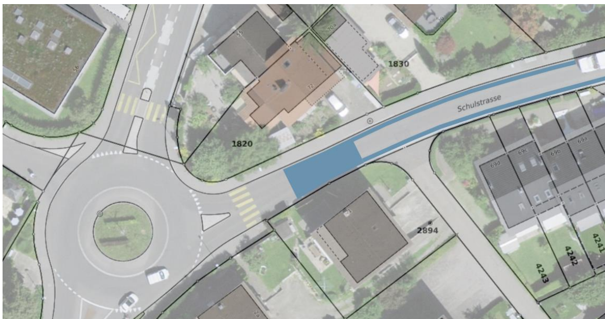
Abbildung 2: Visualisierung der farblichen Gestaltung der Eingangstore und Fahrbahnränder.

Eine farbliche Gestaltung der Strassenoberflächen flankiert die Herabsetzung der Höchstgeschwindigkeit. Die vollflächigen Eingangstore sowie die farbigen Bänder nehmen die Gestaltung bestehender Tempo-30-Zonen in Thun auf, zum Beispiel in der Regiestrasse oder am Steinhäufenweg (vgl. Abbildung 2). Der bestehende Mehrzweckstreifen im Bereich des Strättligenmarktes erhält eine Gestaltung mit einer blauen Welle, analog zu den Innenstadtachsen (vgl. Abbildung 3). Bei den farblichen Interventionen handelt es sich um reine Gestaltungselemente, die keine verkehrsrechtliche Bedeutung haben.