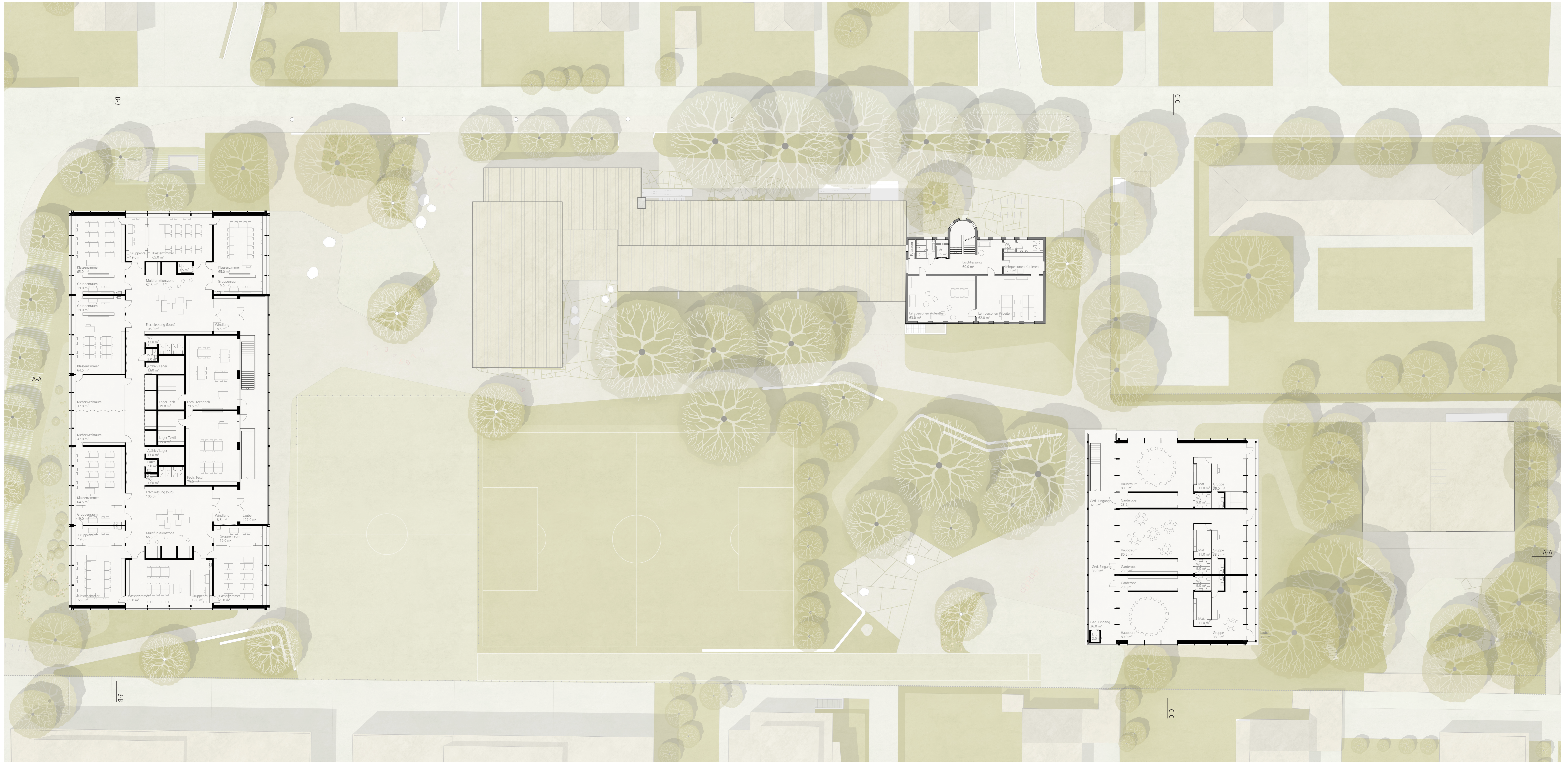
Grundriss Obergeschoss 1:200