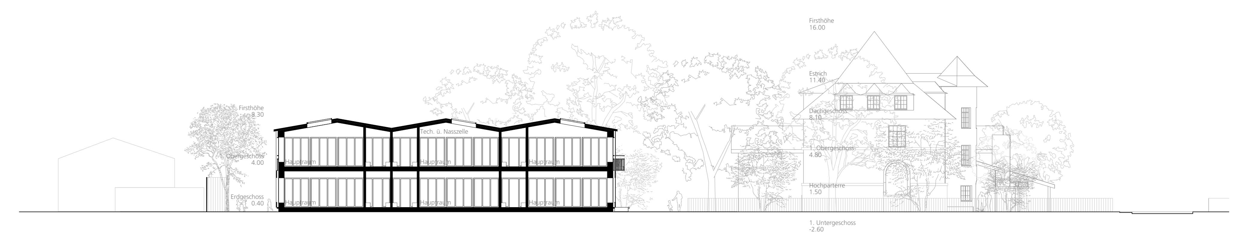
Längsschnitt C-C Basisstufe 1:200