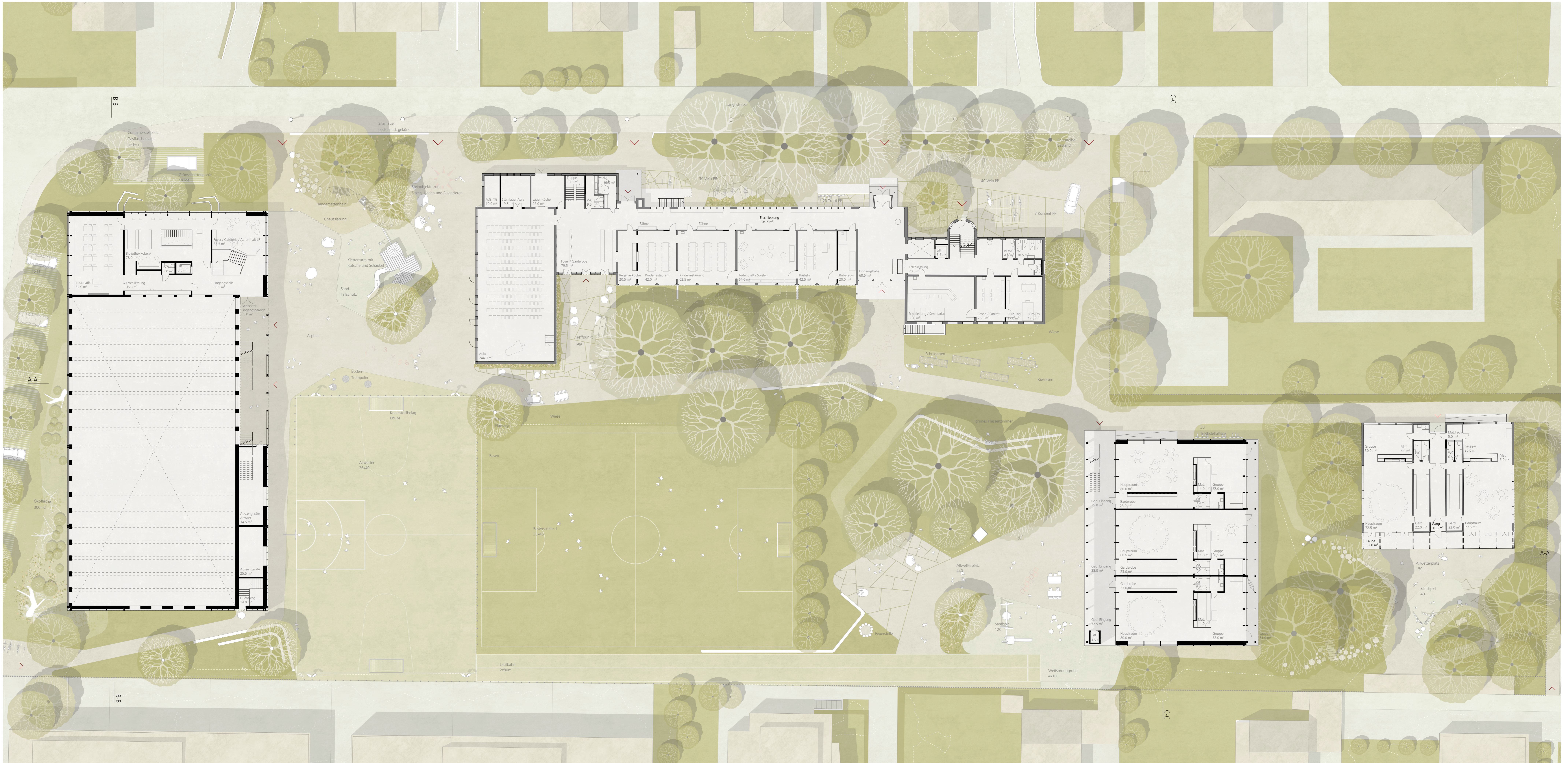
Grundriss Erdgeschoss 1:200