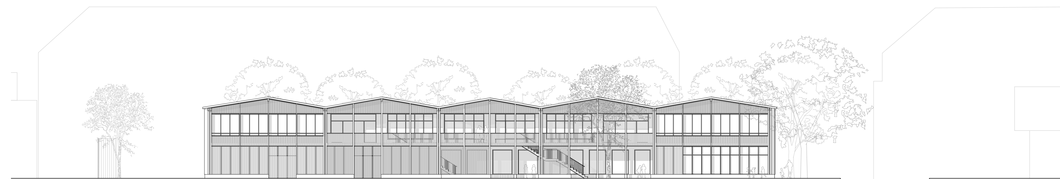
Ostfassade Primarstufe 1:200