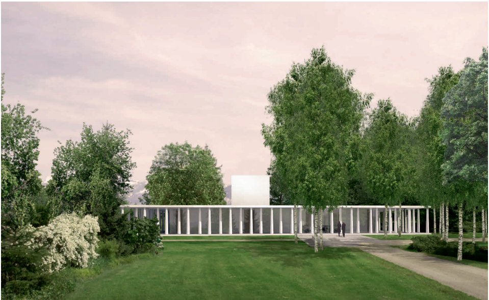
Visualisierung des Projekts «Obon» für den Neubau des Krematoriums beim Friedhof Schoren

Qualität aufweisen. Zudem muss der Neubau die Voraussetzungen schaffen für eine gut funktionierende Organisation des Kremationsbetriebs mit zwei Ofenlinien. Das Siegerprojekt «Obon» des Zürcher Teams Markus Schietsch Architekten GmbH und Schmid Landschaftsarchitekten GmbH erfüllt all diese Ansprüche. Es ist ein ausdrucksstarkes Projekt, das sowohl den Bedürfnissen der Besuchenden wie auch jenen des Friedhofbetriebs entspricht. In unmittelbarer Nähe zum Areal des Friedhofs Schoren am südlichen Stadtrand Thuns sieht das Projekt einen einfach gestalteten, eingeschossigen Pavillon vor, dessen Fassade auf drei Seiten von Säulen geprägt ist. Der Bau weist eine einfache, aber grosse architektonische Ausstrahlung auf und steht in starkem Kontrast zur bewegten Landschaft der Berner Voralpen und zum Baumbestand in unmittelbarer Nähe.