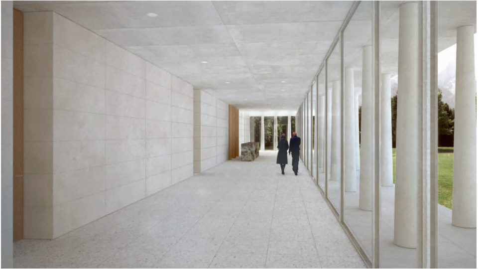
Visualisierung der Eingangshalle