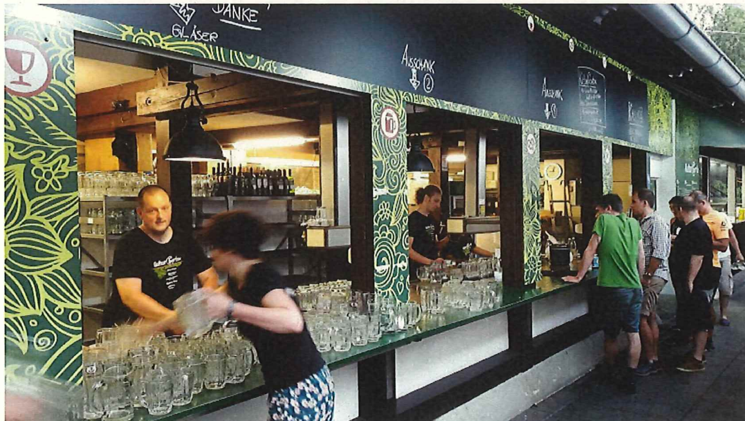
Die Abbildung zeigt ein Beispiel, bzw. eine Idee für eine allfällige Gastro-Infrastruktur.

Für die gastronomische Umsetzung des Biergartens sieht die IG Unterstadt die Wirtshäuser der unteren Hauptgasse vor. Auf diese Weise erhalten die lokalen Wirte endlich eine Möglichkeit, im Sommer Aussensitzplätze betreiben zu können. Zur Zeit hat keines der erwähnten Restaurants Aussensitzplätze und muss jährlich mit bis zu 5 Monaten Flaute rechnen... mit diesem zusätzlichen Angebot können die Liegenschaftsbesitzer ihren Mietern eine echte Chance bieten, die Zukunft erfolgreich meistern zu können. Unter dem Strich wird davon das ganze Gebiet Berntor / Unterstadt profitieren.